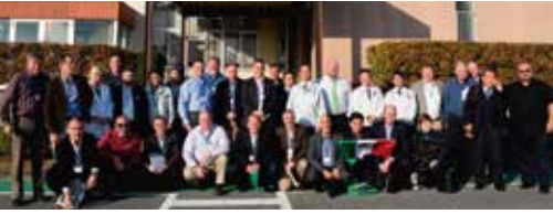
Misión Estudio a Japón 2015