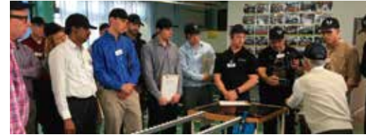
Formación Práctica (Dojo Training)